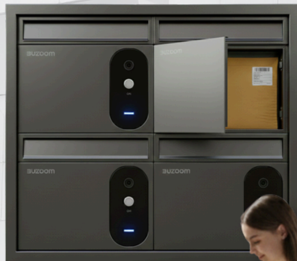
Buzoom Compact V: Dimensiones: 250x300x140mm

Disponible en infinidad de terminaciones y colores