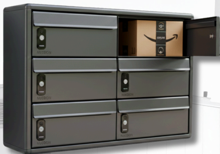
Buzoom Compact H: Dimensiones: 300x150x250mm