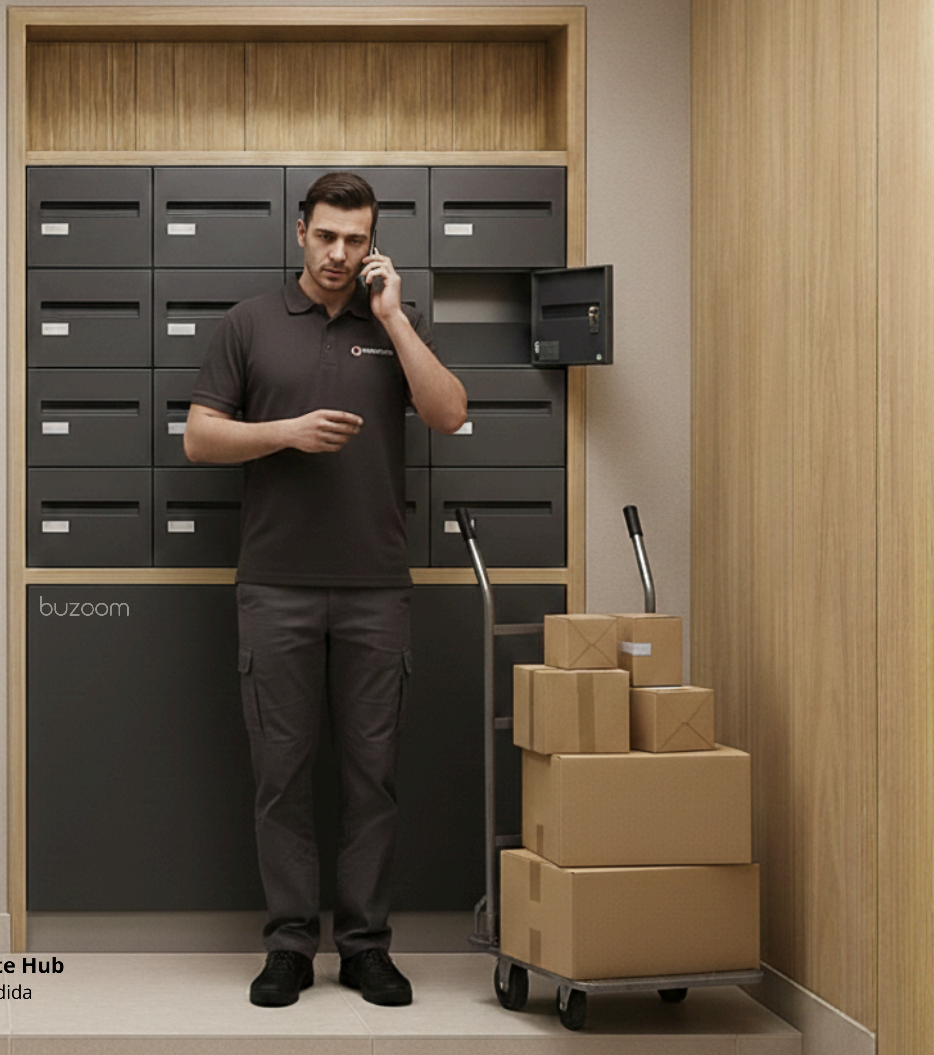
Buzoom Private Hub Fabricación a medida